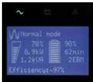
Intuitive LCD-Anzeige für einfache Konfiguration und Verwaltung