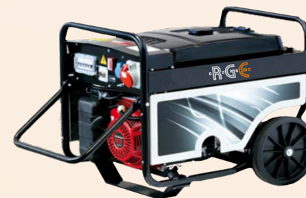
RGE-OPEN-BENZIN 5,0 - 7,3 kVA

Luftgekühlter Benzinmotor , Elektrischer Start, EU-2002-88 Emissionsstandard