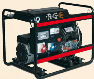
RGE-OPEN-BENZIN 11,8 - 13,8 kVA